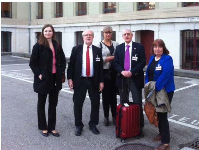
Lika Unika och Handikappförbunden vid CRPD-granskningen, utanför Palais Wilson i Genève

Kommitténs rekommendationer till Sverige som kom i april är ett viktigt underlag för vårt fortsatta arbete kring konventionen och visar tydligt betydelsen av att bidra till och närvara vid granskningsprocesserna. Många av våra synpunkter återspeglas i rekommendationerna. Nu gäller det att göra praktik och politik av rekommendationerna och en del i det är att delta i kvalitetsgranskningen av översättningen av desamma.