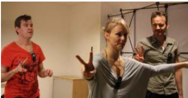
5-årsjubileum med Östra Teaterns ensemble i pjäsen "Churchill var inte heller klok".

Året avslutades med Lika Unikas femårsjubileum och den nya regeringens första funktionshindersdelegation.