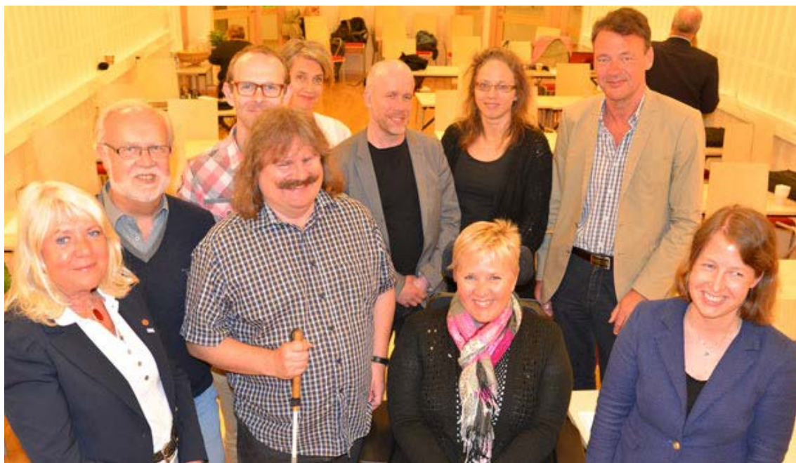
Bild på styrelsen

Lika Unika har under 2014 haft en omsättning på ca 2 miljoner kronor vilket finansierats av medlemsavgifter och samarbetsmedel.