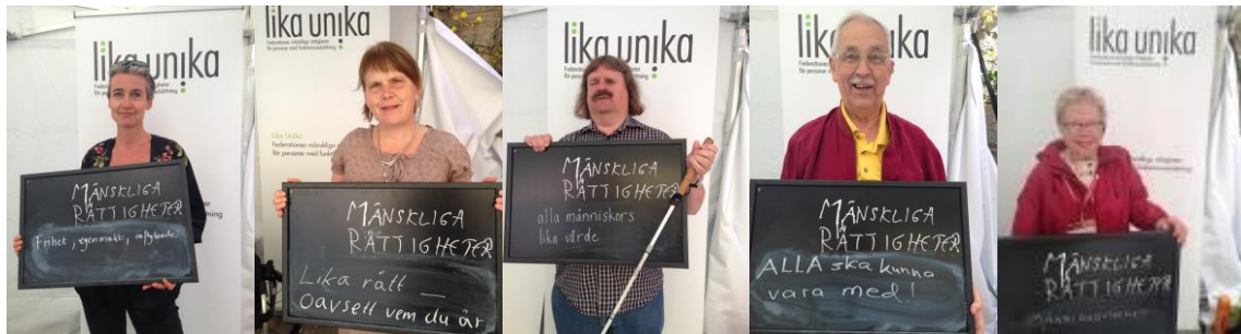
Vad är mänskliga rättigheter? Instagramkampanj i Almedalen 2015.