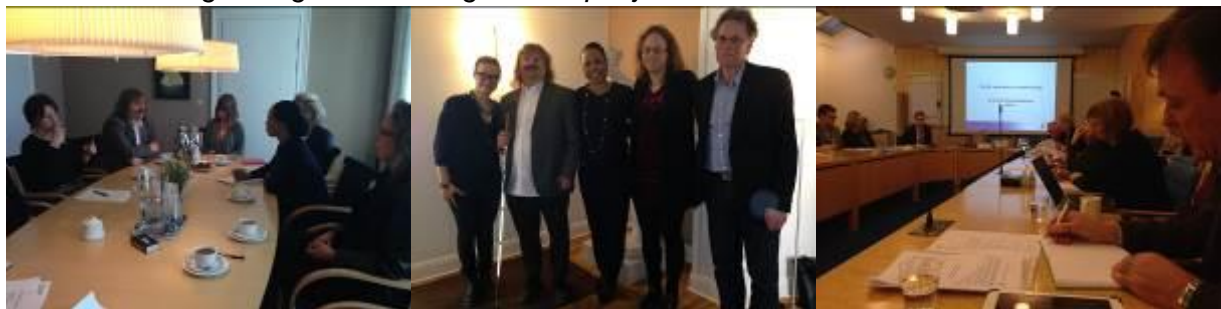
Möten med kulturminister Alice Bah Kunkhe samt funktionshinderdelegationens möte.